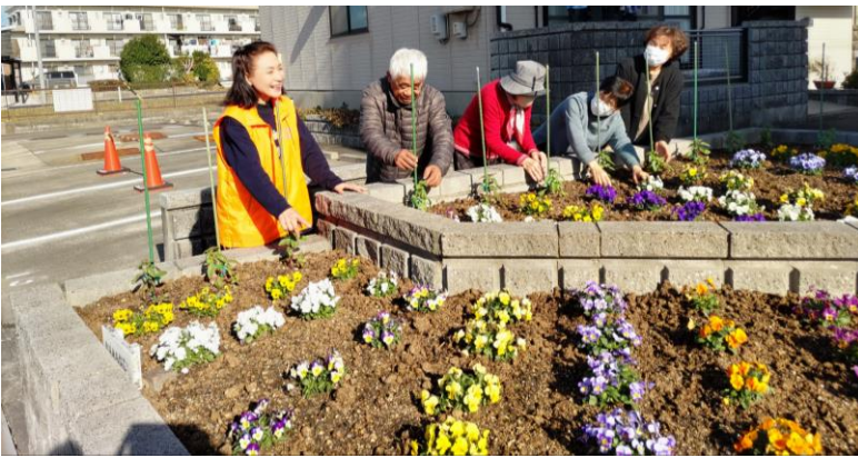
五丁目ロイヤルマンション前のカラフルな「ビオラ」