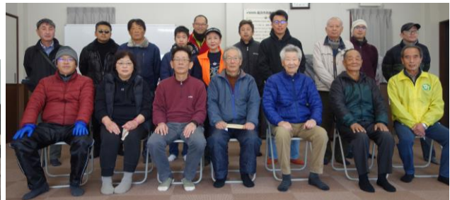
大掃除に参加したメンバー 裏面もご覧ください