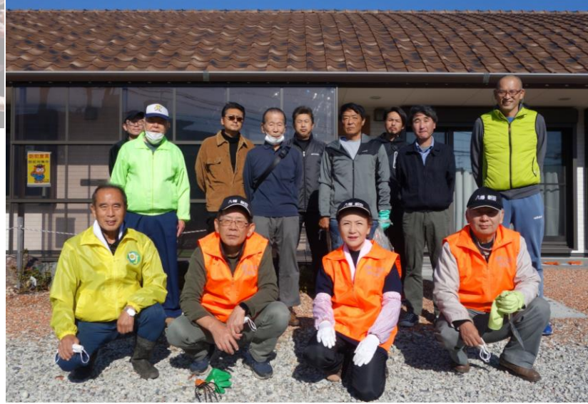
きずな会館花植え協力者(役員・事業部OBの皆さん) 11月27日