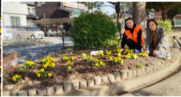
大坪公園内の黄色の「パンジー」