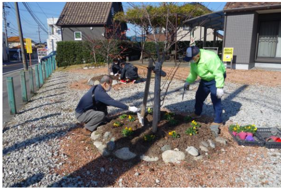
春の花「パンジー」への植替え

皆さま、明けましておめでとうございます 街角に花々を！ 心豊かに！ 明るい街づくりに貢献します 今年も宜しくお願い致します